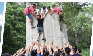
啟發潛能挑戰營（中二）