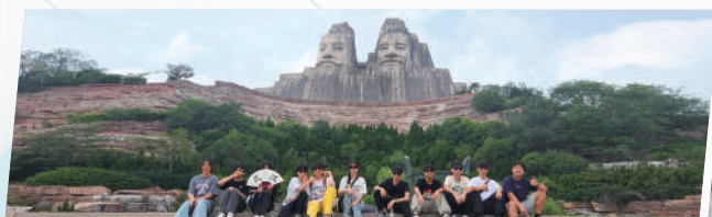
走遍大中華尋龍之旅（中二及中三）