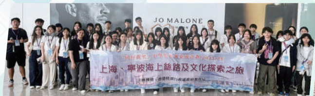
上海、寧波海上絲路及文化探索之旅（中三至中五）