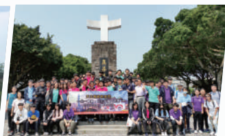
「一生一體驗」台北交流團（中四）