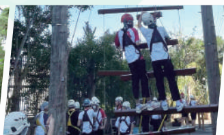
自我探索訓練營（中三）