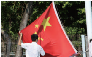
本校升旗隊負責學校陸運會升旗禮