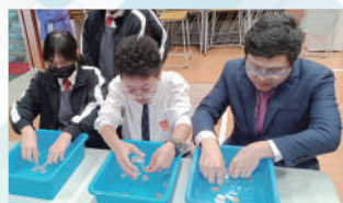
探究水的表面張力