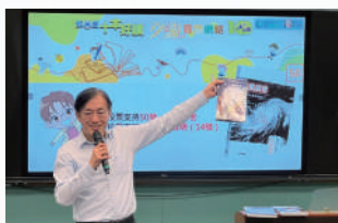
新民名人講座： 岑智明先生(前天文台台長)