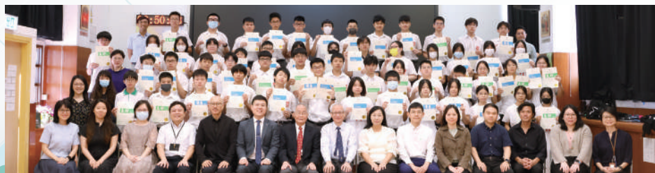
第七十五屆校際中英文朗誦比賽得獎者