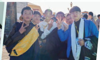
大美青海行交流團（中五）