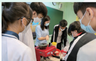
咖啡拉花體驗工作坊