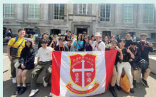
鑽禧英國宗教及文化探索之旅

為使學生發展多元智能，使其身、心、靈均獲全面均衡的發展，本校提供各式各樣的課外活動，包括宗教、學術、體藝、興趣及服務五類，以配合學生不同性向的發展。此外，學生通過參加各服務團隊（包括紅十字團、少年警訊、公益少年團、交通安全隊、童軍、民安隊、升旗隊等），讓他們建立自信和責任感，服務社會，成為良好學生及公民。中一級推展「一人制服」計劃，所有同學均須參加一項服務／制服團隊。（本校設有學生活動支援津貼及全方位學習津貼，資助同學參與校內、校外／境外活動。）