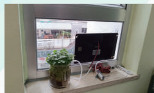
課室太陽能種植體驗活動