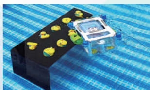
設計及製作海洋航行器