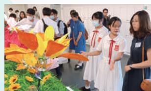
設計及製作機械花