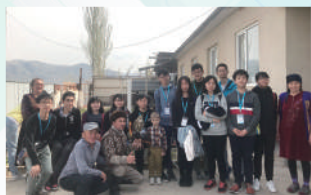
「一帶一路」哈薩克斯坦考察之旅