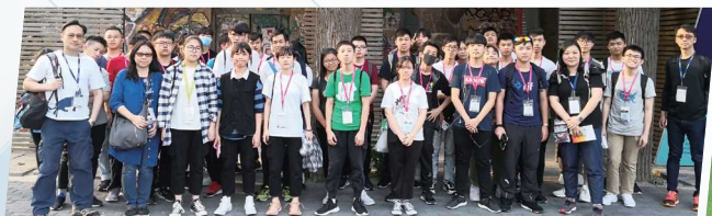
中三北京、瀋陽考察團