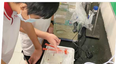
智能馬蹄蟹校園保姆計劃