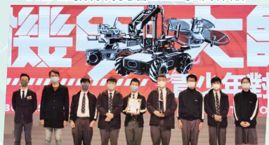
Robomaster 機甲大師青少年對抗賽