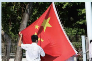
本校升旗隊負責學校陸運會升旗禮