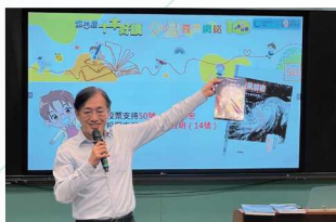
新民名人講座： 岑智明先生（前天文台台長）