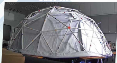
STEAM教育博覽會2022參展作品