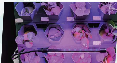
智能水種榮獲STEM科技應用大獎