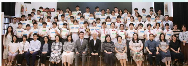
第七十四屆校際中英文朗誦比賽得獎者