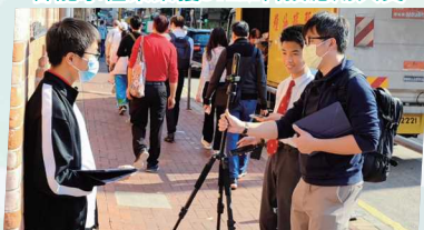
跨世代漫遊虛擬實境(VR)製作