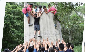
中二啟發潛能挑戰營