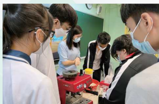
咖啡拉花體驗工作坊