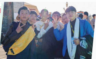
中五、中六大美青海行交流團