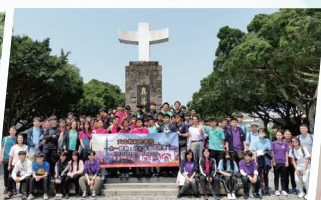
中四「一生一體驗」台北交流團