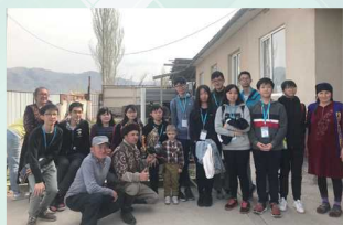
「一帶一路」哈薩克斯坦考察之旅

為使學生發展多元智能，使其身、心、靈均獲全面均衡的發展，本校提供各式各樣的課外活動，包括宗教、學術、體藝、興趣及服務五類，以配合學生不同性向的發展。此外，學生通過參加各服務團隊（包括紅十字團、少年警訊、公益少年團、交通安全隊、童軍、民安隊、升旗隊等），讓他們建立自信和責任感，服務社會，成為良好學生及公民。中一級推展「一人制服」計劃，所有同學均須參加一項服務／制服團隊。（本校設有學生活動支援津貼及全方位學習津貼，資助同學參與校內、校外／境外活動。）