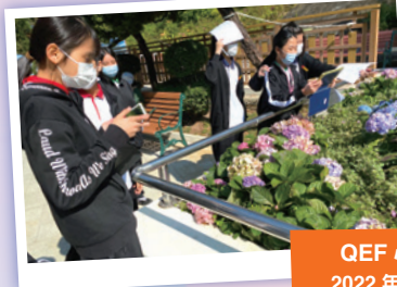
QEF 心靈教育 2022 年 1 月 11 日