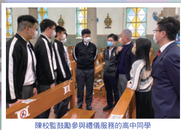
陳校監鼓勵參與禮儀服務的高中同學