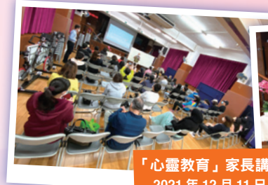
「心靈教育」家長講座 2021 年 12 月 11 日