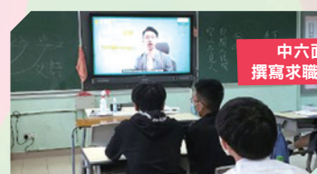
中六面試及 撰寫求職信工作坊