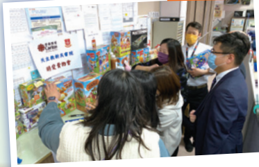
校內明愛賣物會 2021 年 12 月 10 日